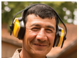
■ Ropa de trabajo

Protección y ropa adecuadas para cada oficio