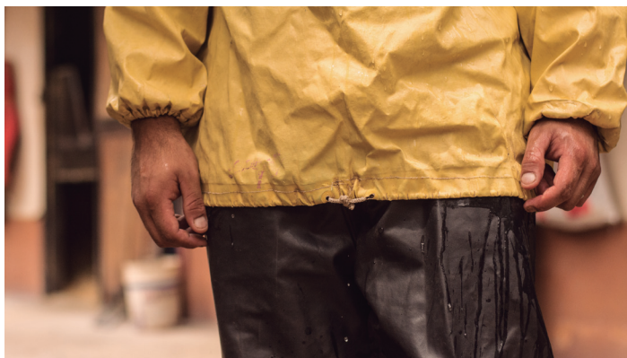
■ Ropa de trabajo

Protección y ropa adecuadas para cada oficio